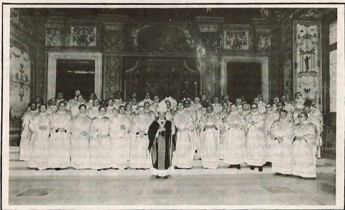
El Sumo Pontífice Pablo VI, con los Prelados latinoamericanos asistentes a la XV Reunión Ordinaria del CELAM, pocos momentos después de la Concelebración Eucarística que clausuró la Reunión.